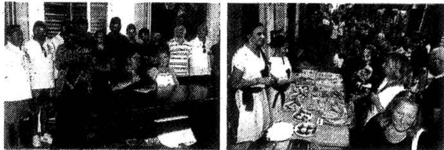
La presentazione della manifestazione in municipio. A destra, la festa medievale di venerdì

Qui avrà inizio la grande serata con la lettura del proclama delle nozze e la cerimonia del taglio della torta da parte degli sposi che da lontano faranno